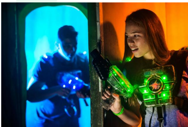
Lasertag: Foto: Baltic Swish GmbH