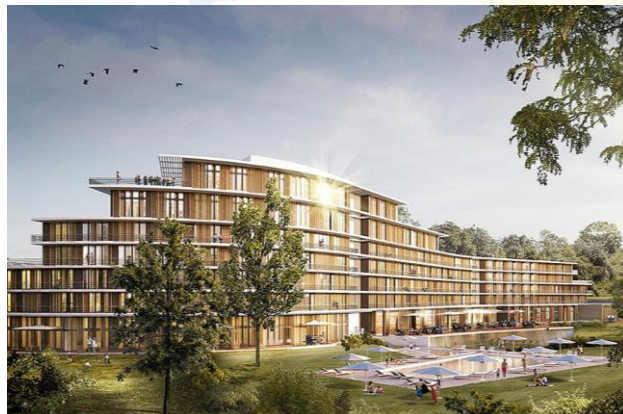
Visualisierung des neuen Hotels: Foto: Dorint Hotels Betriebs GmbH

Beide Projekte stärken die wirtschaftliche Entwicklung der Region und setzen frische touristische Akzente