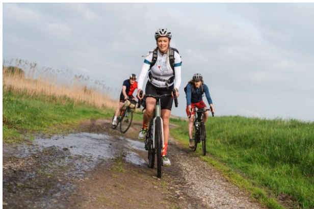
Graveln an der Peene in der Mecklenburgischen Schweiz

Die Mecklenburger Seen Runde (MSR) zählt zu den bedeutendsten Langstrecken-Events. Am 29./30. Mai 2026 starten ca. 5 000 Radsportler zur 300-Kilometer-Tour durch die beeindruckende Seenlandschaft.