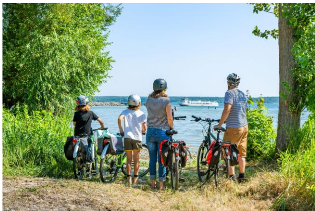
Familie am Müritzufer: Foto: MV-T/Tiemann

Am 24. April und 25. April 2026 wird zum ersten Mal in ca. 15 Orten der Seenplatte angeradelt. Es erwarten den Besucher geführte Gruppentouren sowohl für sportliche Radler als auch für Familien. Die rund 20 Orte setzen unterschiedliche Schwerpunkte: manche starten mit einer familienfreundlichen Tour, andere legen Wert auf Naturerlebnisse oder kombinieren den Tag mit einem Kulturprogramm. Der Anradeltag lädt zu einer gemeinsam Entdeckungsreise ein.